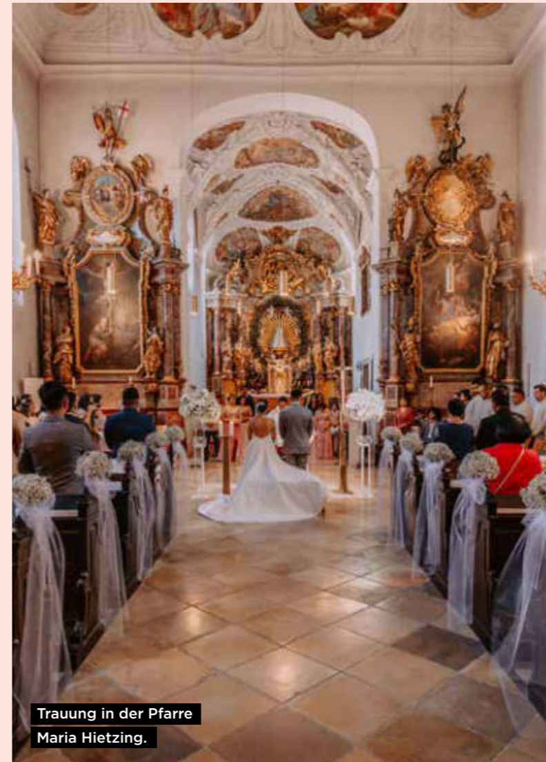
Trauung in der Pfarre Maria Hietzing.