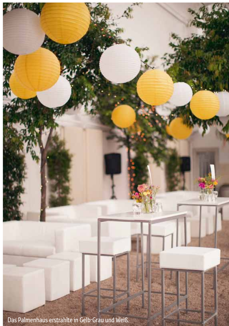
Das Palmenhaus erstrahlte in Gelb-Grau und Weiß.

Gudrun: „Die Farbkombination Gelb-Grau hat mir immer schon gefallen.“